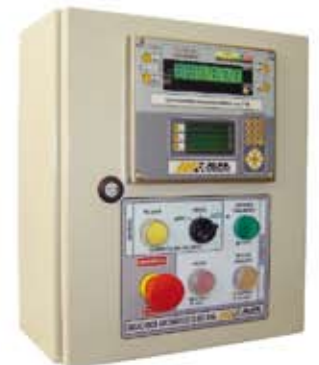
Painel de Controle com Indicador Digital 3106C1