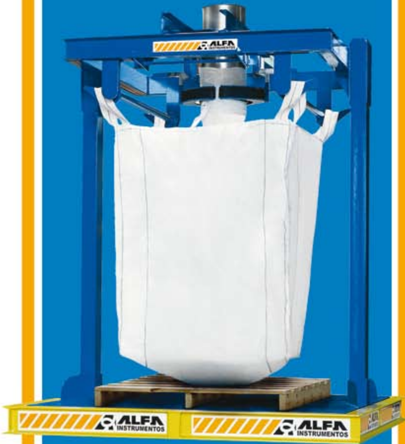
ENSACADOR SUSPENSO DE BIG-BAG